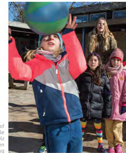
Der Schulhof der Grundschule Mascheroder Holz animiert mit vielen Geräten zur Bewegung