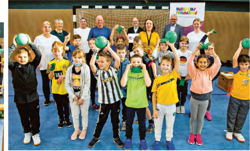
Der Startschuss in der Grundschule Broistedt