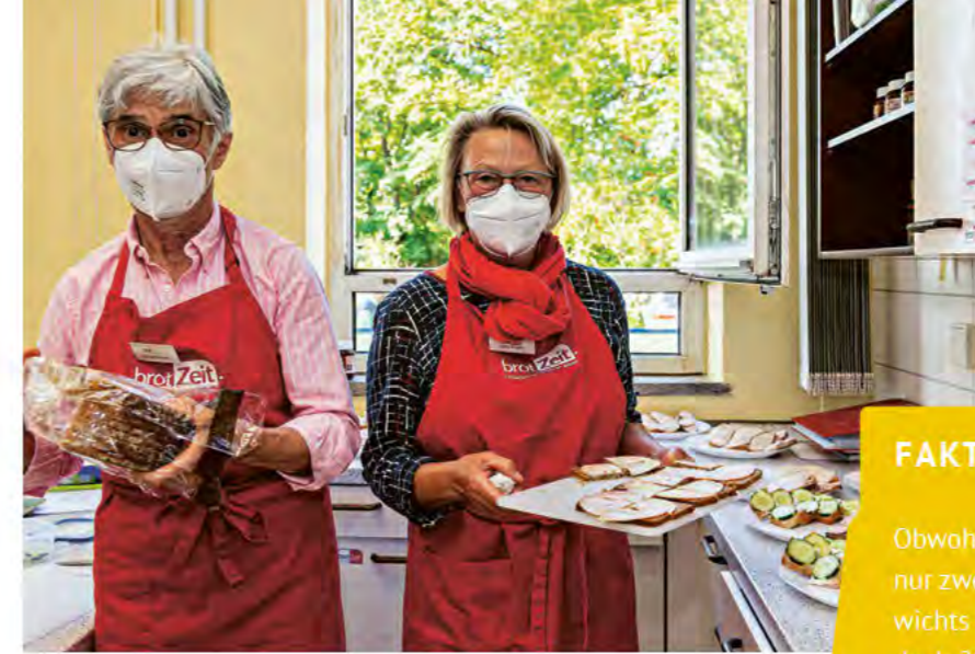
Die Frühstücke für die Kinder werden von ehrenamtlichen Helferinnen vorbereitet