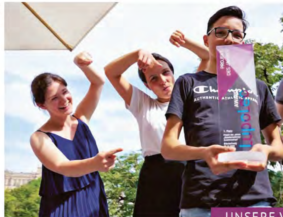
Premiersieger des Projekts des Jahres wurde das Mentoringprogramm von ROCK YOUR LIFE!