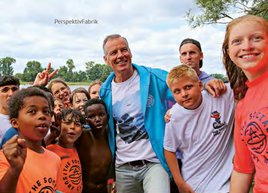
Henry Maske im Kreis von Kindern in der PerspektivFabrik