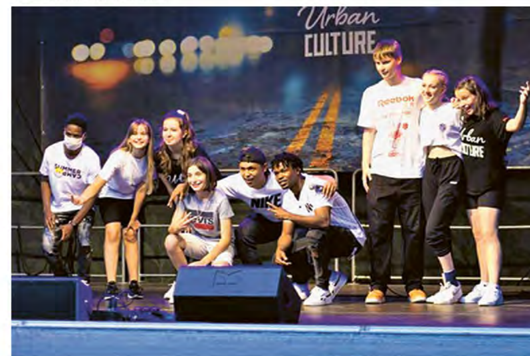
Auf der Bühne: Kids von Urban Culture

anderem auf dem Instagram-Kanal von Urban Culture. Der Werbeclip zum Sommercamp 2021 erreichte dort bereits mehr als 5.000 Instagram-User. Was für ein ermutigendes Zeichen!