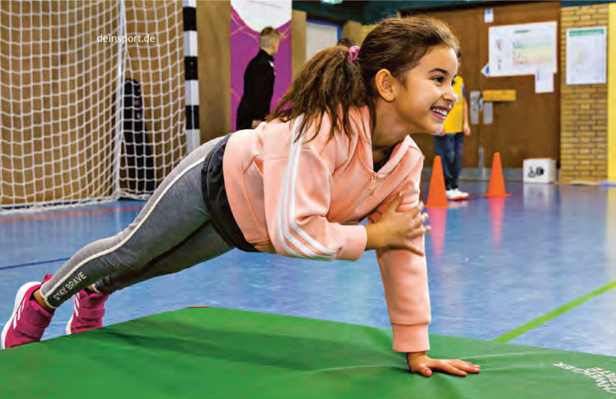
Kraft- und Ausdauerübungen stehen mit auf dem Programm