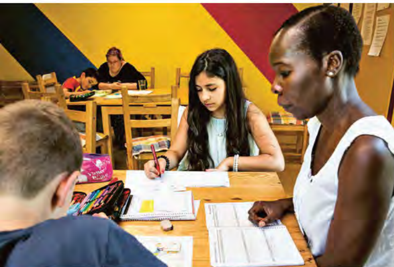
Ehrenamtliche unterstützen die Kinder bei ihren Hausaufgaben