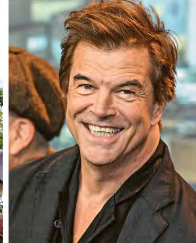
Campino wurde die erste Persönlichkeit des Jahres im Rahmen des LupoLeo Awards

„UNSERE VERANTWORTUNG IST ES, UNSEREN KINDERN FREIRAUM FÜR IHRE ZUKUNFTSGESTALTUNG ZU BIETEN.“