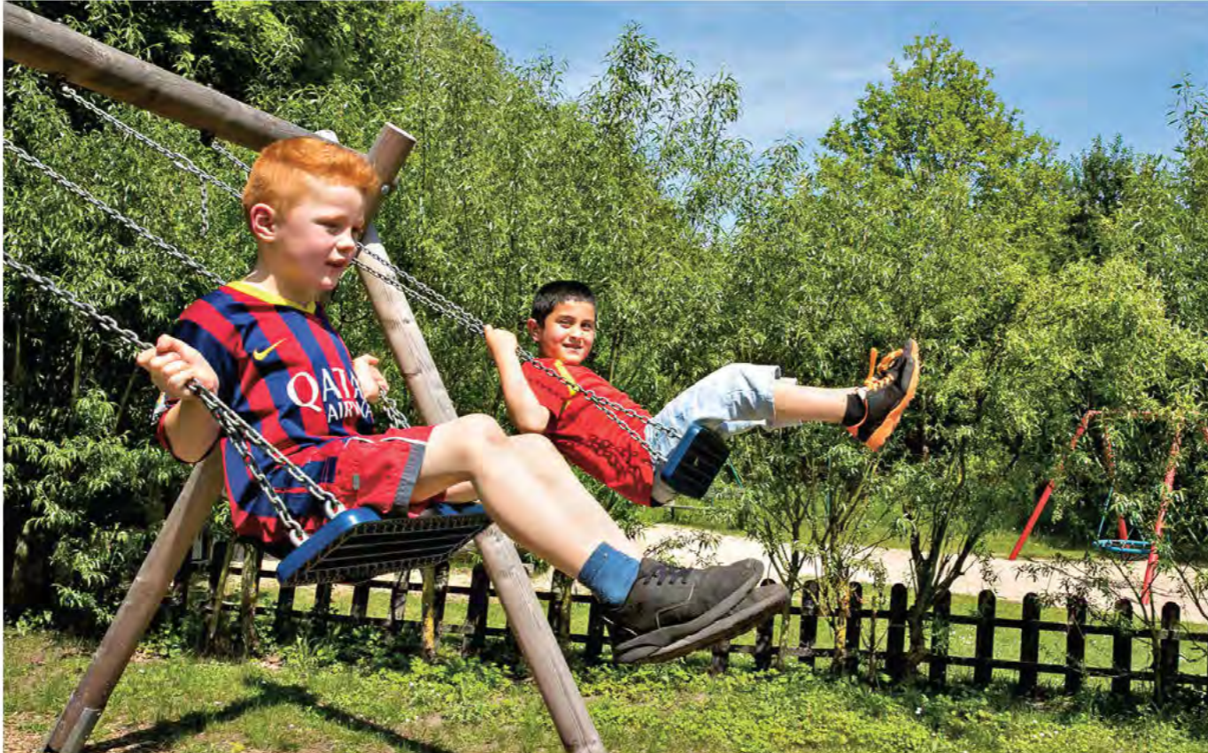
Nach der Schule ist für die Kinder erstmal Entspannung angesagt