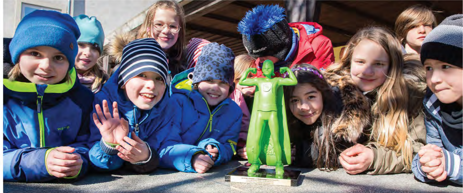
Schülerinnen und Schüler der Klasse 3a der Grundschule Mascheroder Holz präsentieren ihre step BraWo-Trophäe

Bewegungsmangel: Nur jedes fünfte Mädchen und jeder dritte Junge im Alter von sieben bis zehn Jahren erreicht die Bewegungsempfehlung der Weltgesundheitsorganisation (WHO) von mindestens 60 Minuten körperlicher Aktivität am Tag.