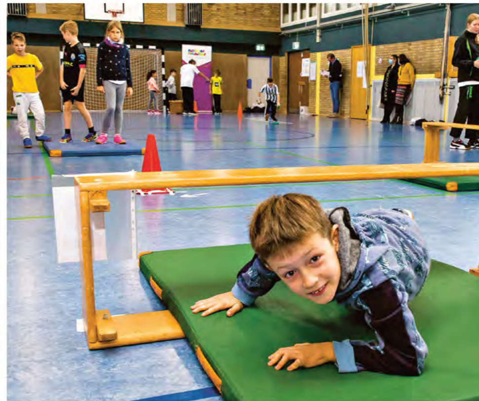
Für die Tests gibt es verschiedene Stationen