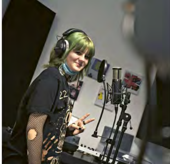
Eigene Rapsongs werden im Studio aufgenommen