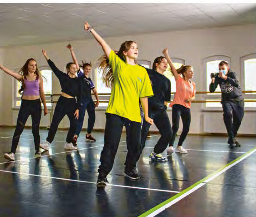
Sportliche Angelegenheit: Streetdance