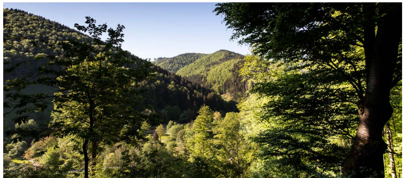
Der Wald zeigt sich nach den guten Witterungsbedingungen 2023 in diesem Frühjahr von seiner schönsten Seite, wie hier im Kellwassertal nahe Torfhaus im Harz.