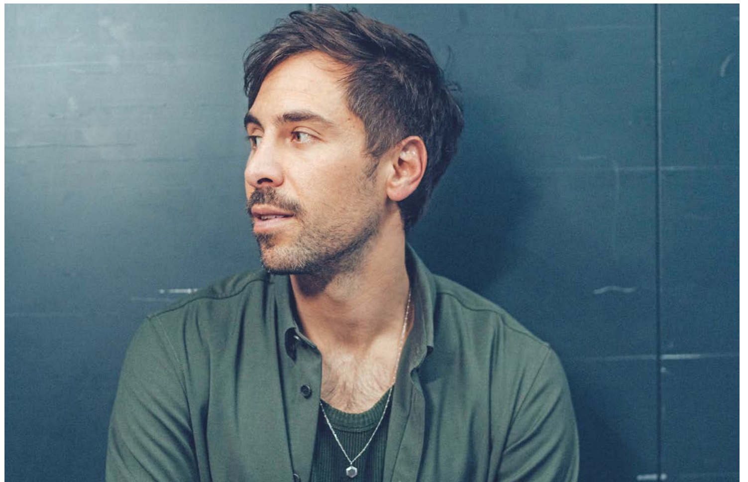
BRAWO-MeinKonto empfehlen und VIP-Tickets für Singer-Songwriter Max Giesinger gewinnen.

Mehr Informationen zum kostenlosen Girokonto der Volksbank BRAWO gibt es unter brawo-meinkonto.de