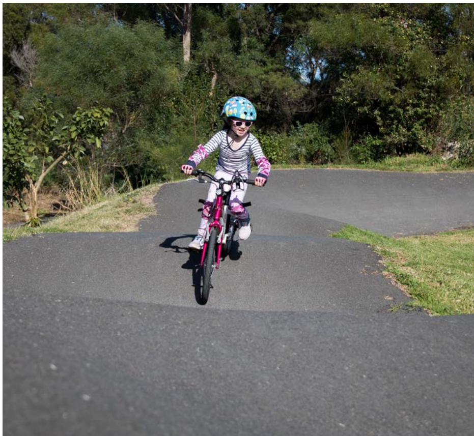
Ein Pumptrack, ein asphaltierter Rundkurs für Fahrräder, soll Teil des Projekts werden.