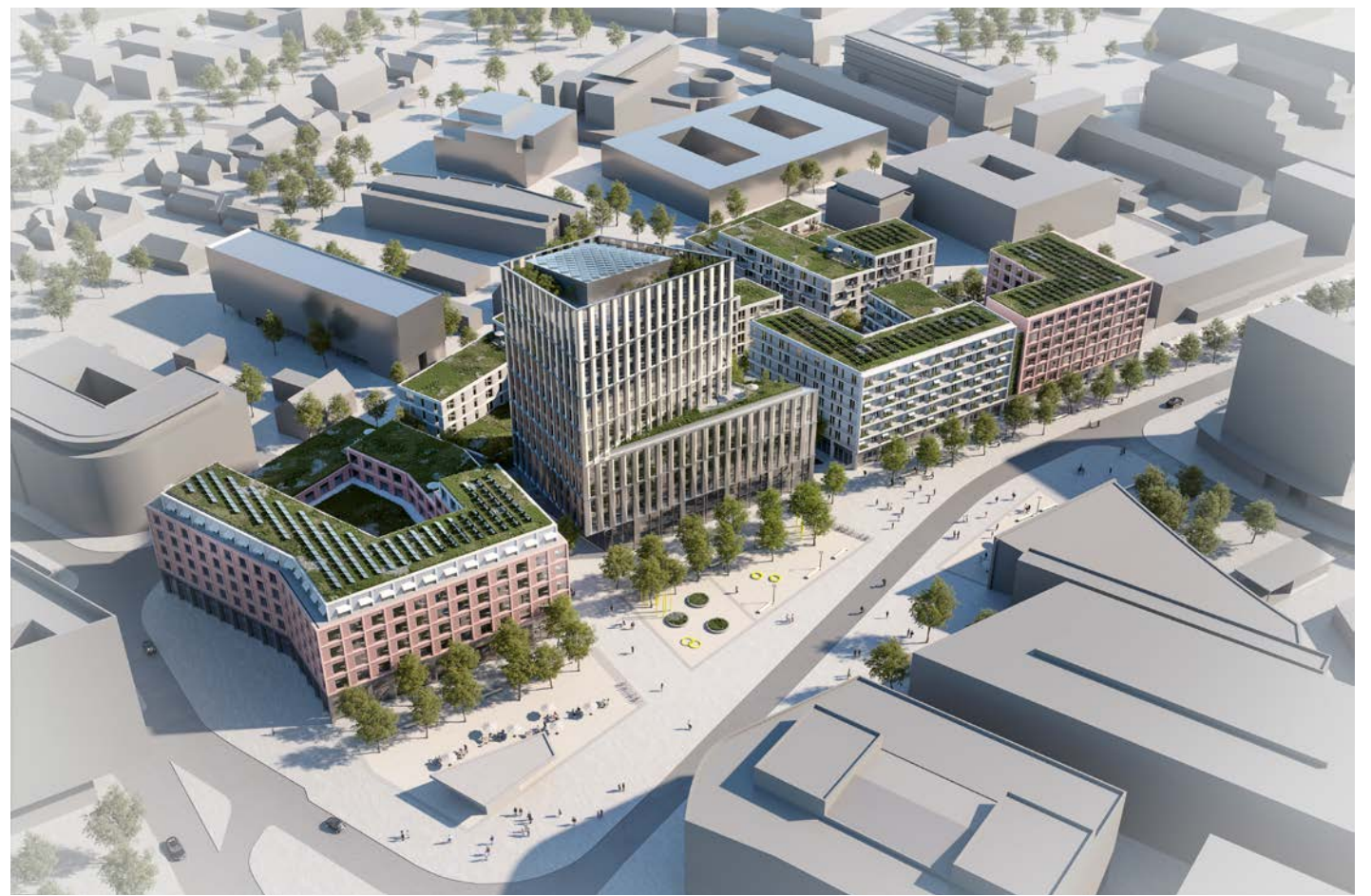
Der Gewinnerentwurf des Architekten-Wettbewerbs von KSP Engel für die BRAWO City in Wolfsburg.

Geplant ist, dass das Areal sich durch einen Mix aus Wohnen, Büro, Einzelhandel und Gastronomie sowie durch attraktive Fassaden und eine nutzerorientierte Außenraumgestaltung auszeichnen soll. Als Erkennungsmerkmal fungiert ein 13-geschossiges Hochhaus, das mit den Hochhäusern in unmittelbarer Umgebung