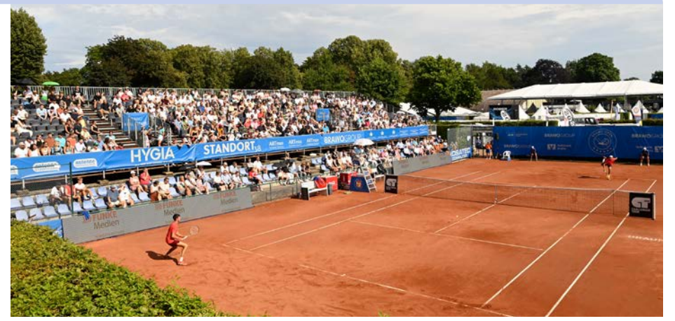
Großer Sport und große Künstler: Das Programm zu den BRAWO OPEN 2024 bietet alles, was Tennis- und Partyfreunde begeistert.