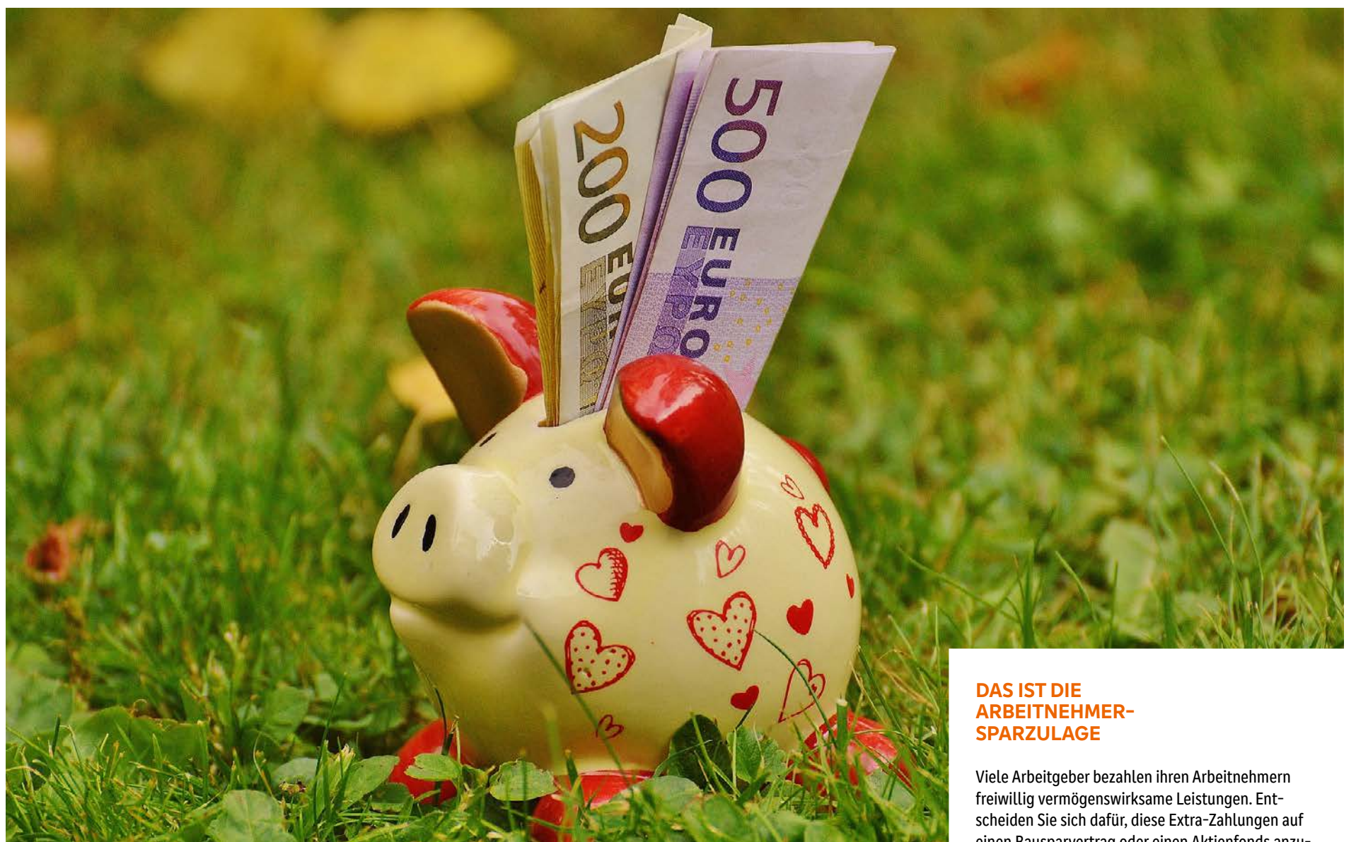
Da freut sich das Sparschwein: 2024 steigt die Arbeitnehmer-Sparzulage.