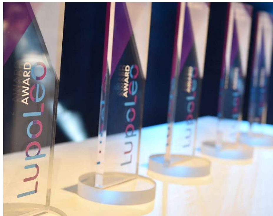
Der LupoLeo Award wird auch 2024 in den Kategorien „Projekt Award“, „Persönlichkeit des Jahres“ und „Wahre Helden“ vergeben.

Für die Auszeichnung wurden im Vorfeld sieben prominente Persönlichkeiten von dem gemeinnützigen Analysehaus Phineo gAG als neutrale Instanz nominiert. Das Jugendkomitee hat aus diesen nun die „Persönlichkeit des Jahres“ gewählt und die drei Finalisten kommuniziert: Komikerin, Sängerin und Schauspielerin Carolin Kebekus, Chemikerin, Youtuberin und Wissenschaftsjournalistin Mai Thi Nguyen-Kim und der ehemalige Formel-1-Weltmeister Sebastian Vettel sind in der Endauswahl.